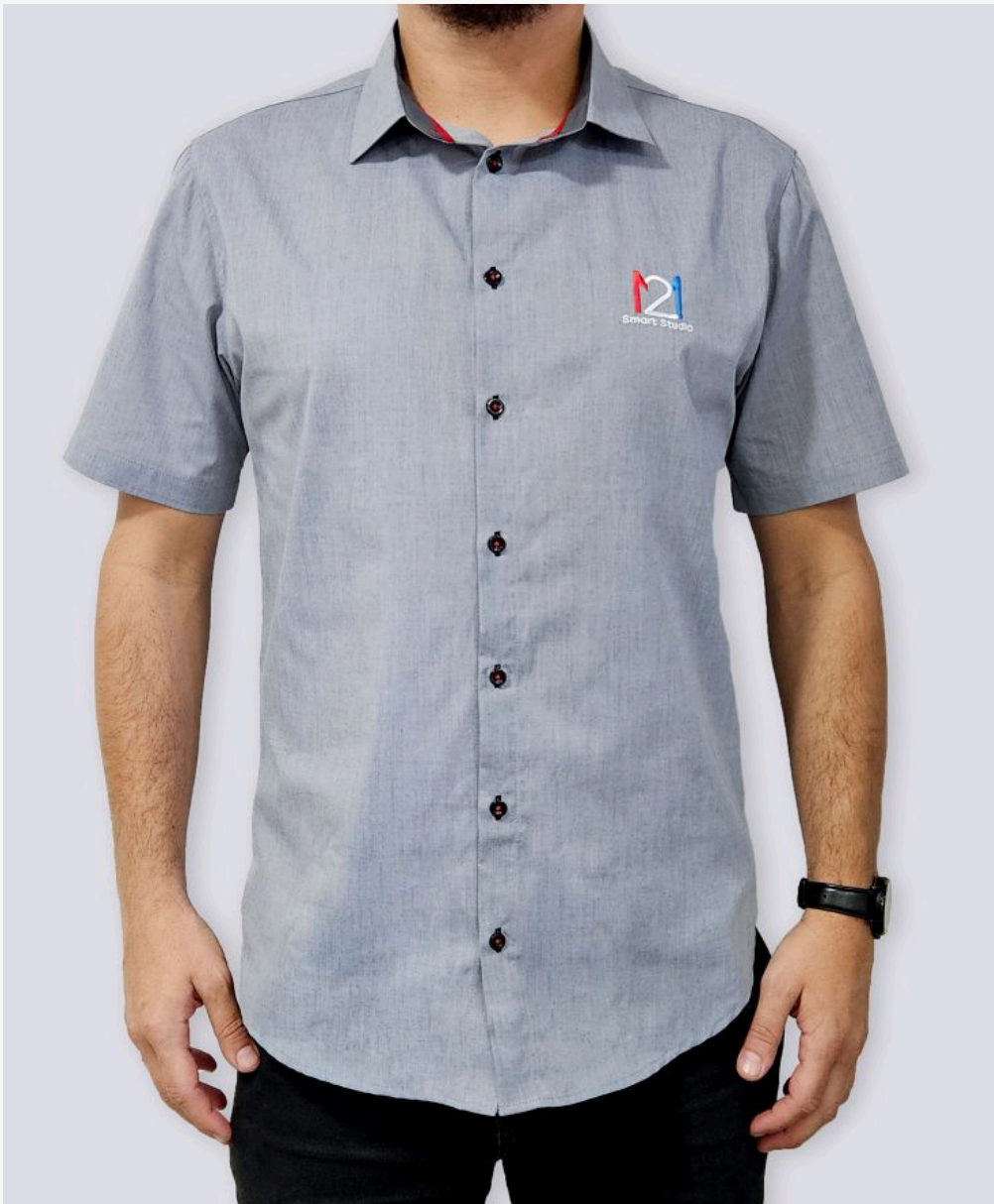
Camisa manga curta