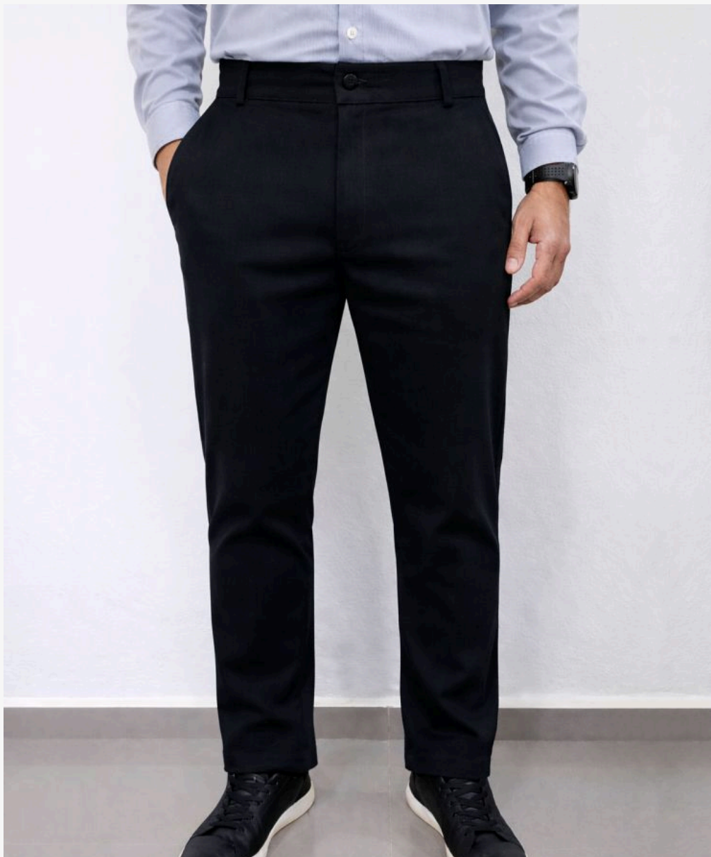
Calça de sarja masculina