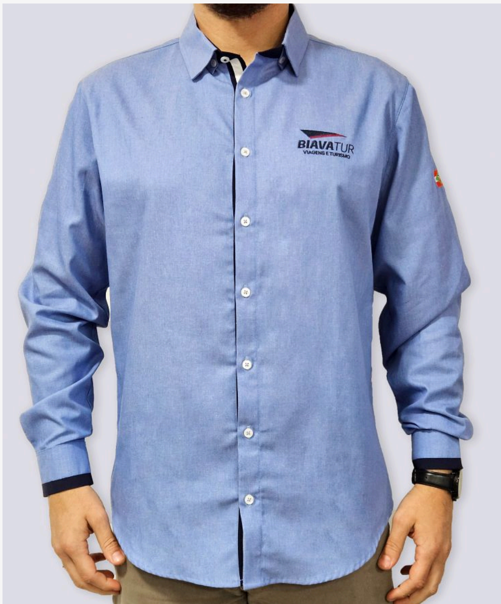
Camisa manga longa com detalhe