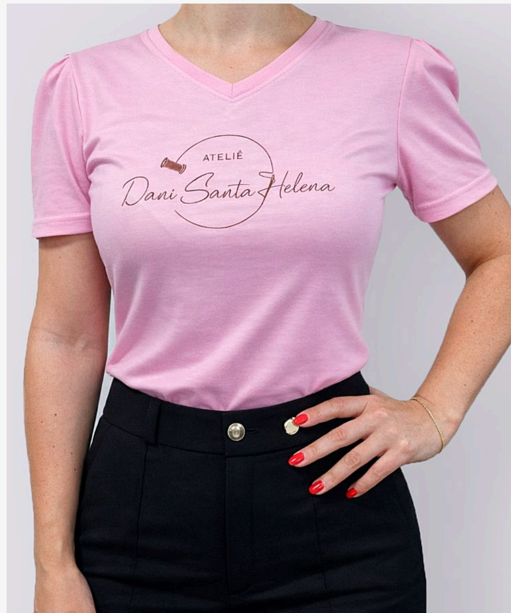
T-shirt manga princesa