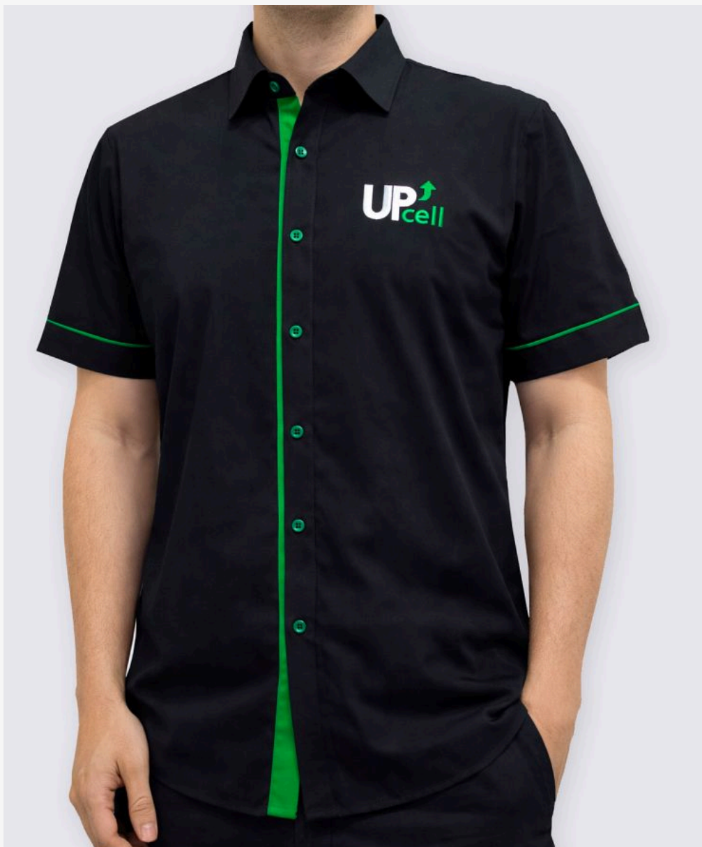
Camisa manga curta com detalhe