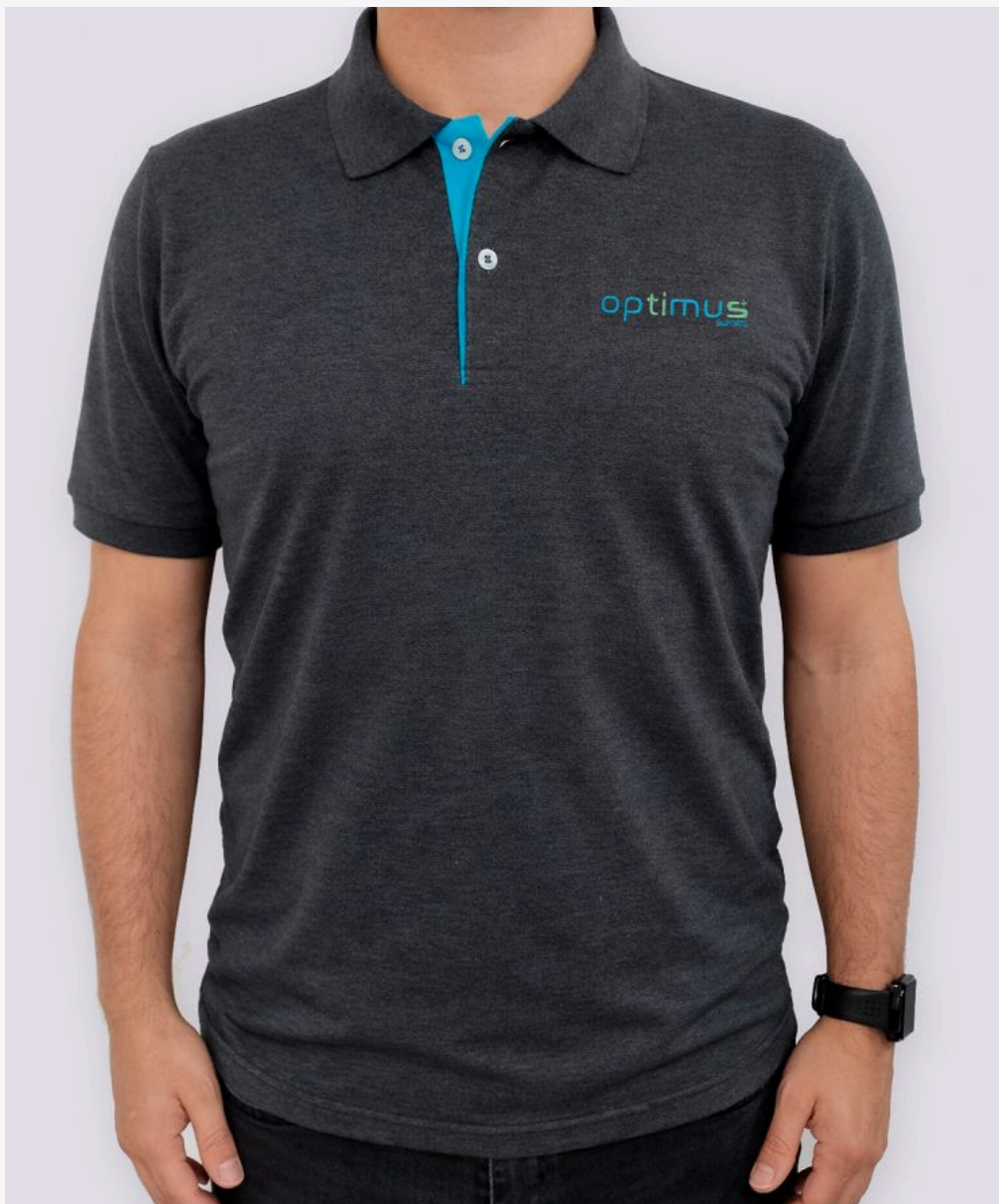
Gola polo com punho