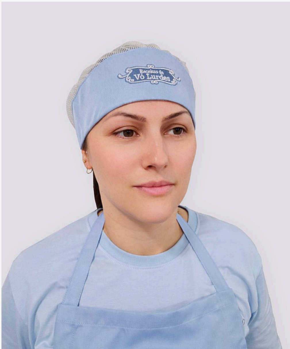
Touca de redinha