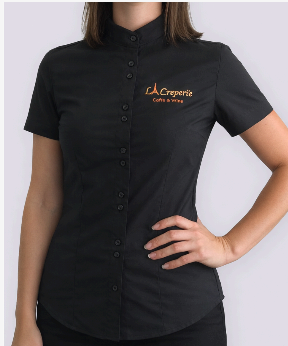
Camisete gola padre