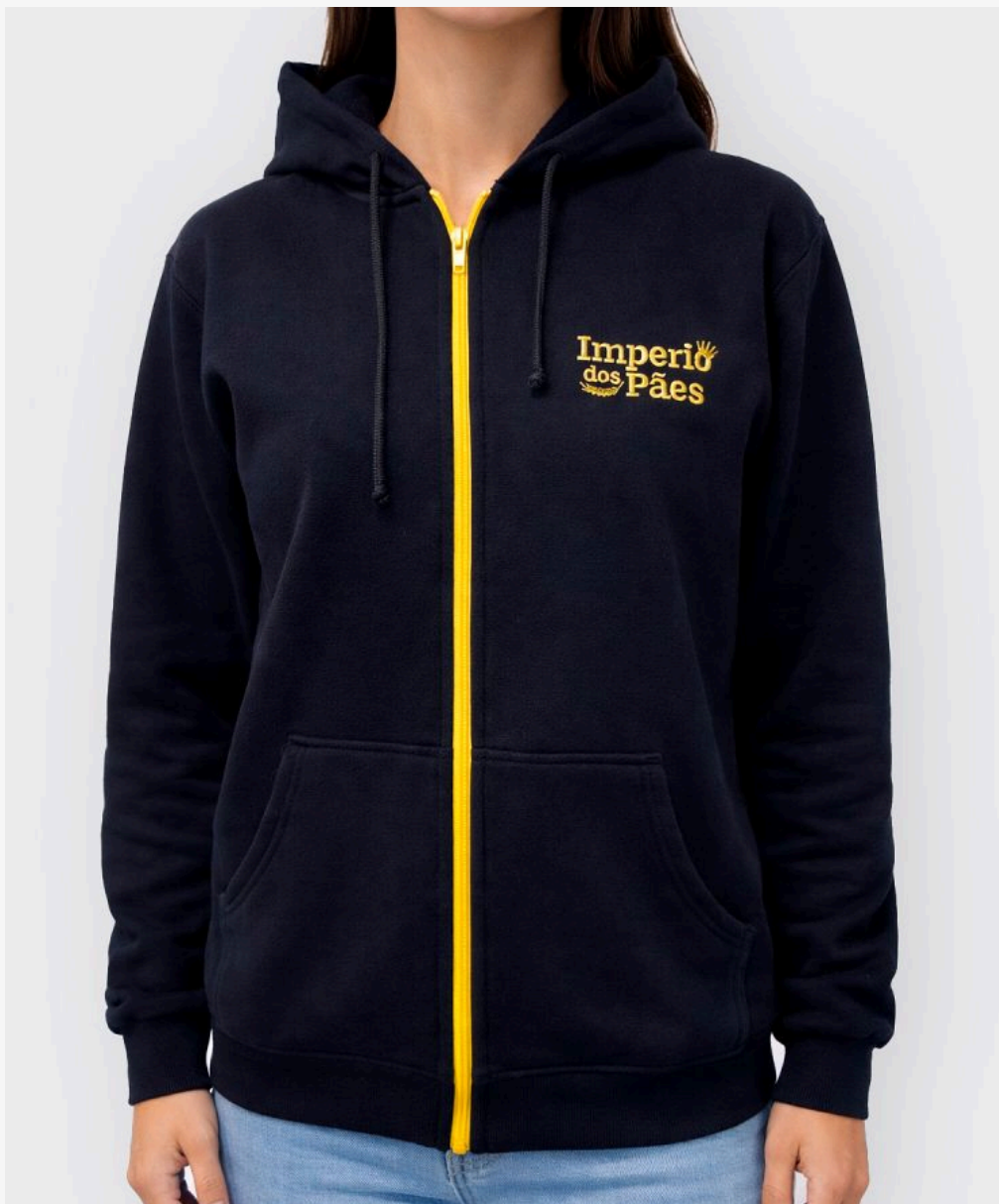
Jaqueta de moletom com capuz