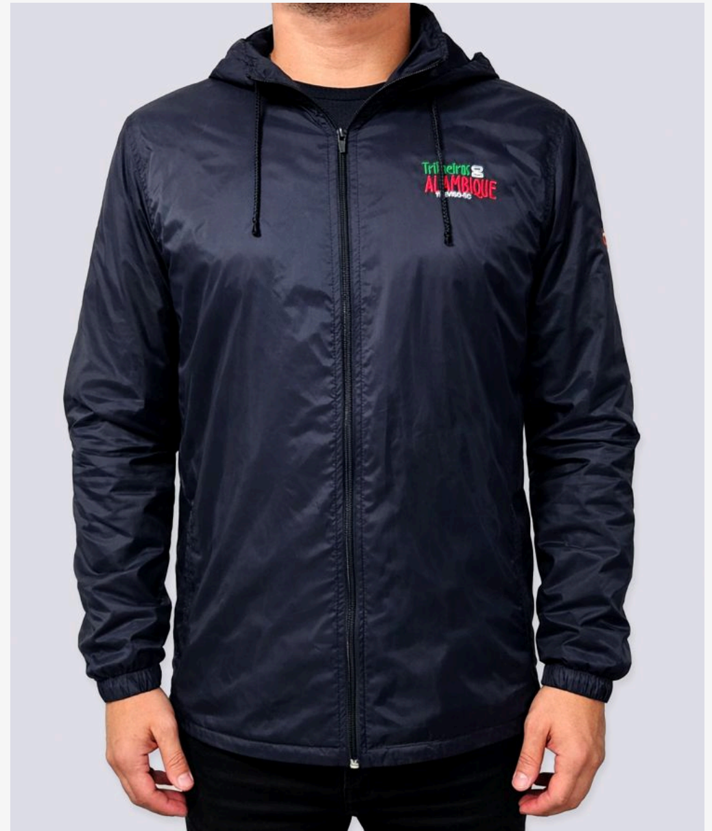
Jaqueta corta vento