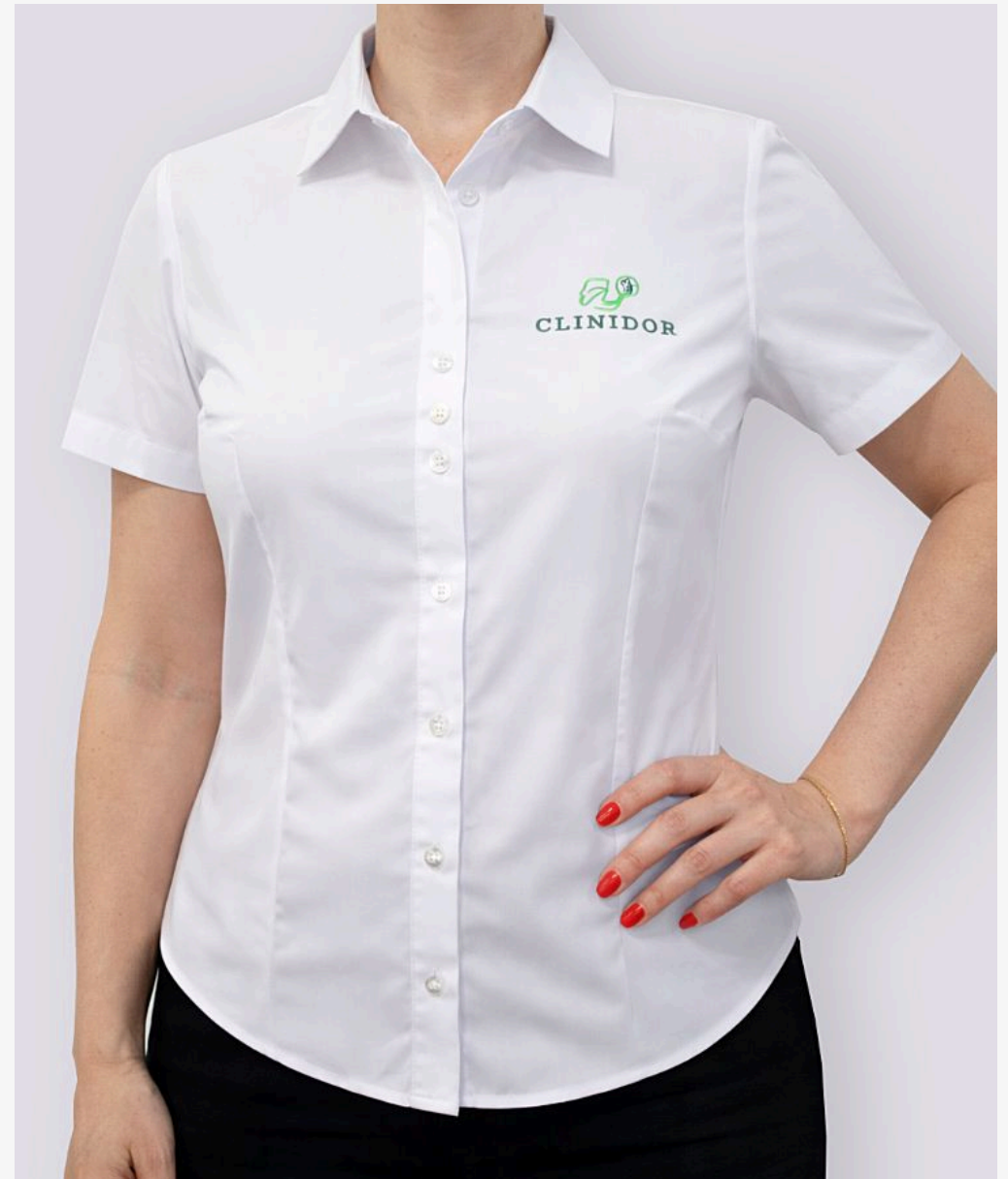
Camisete manga curta