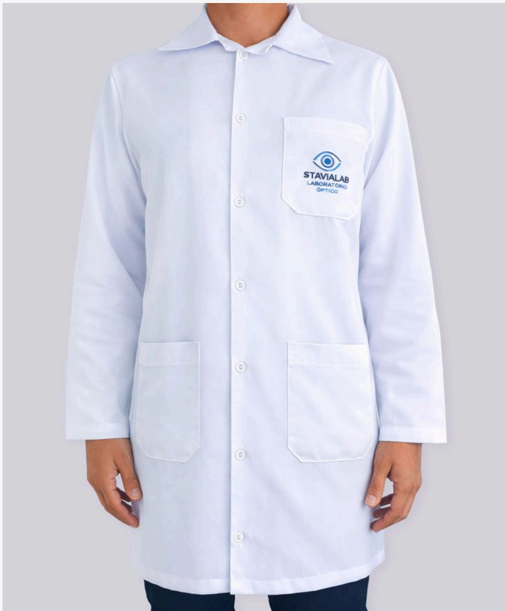
Jaleco manga longa masculino