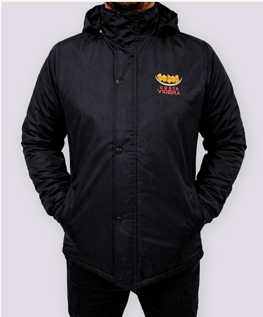
Jaqueta com proteção de zíper masculino Ref: 380