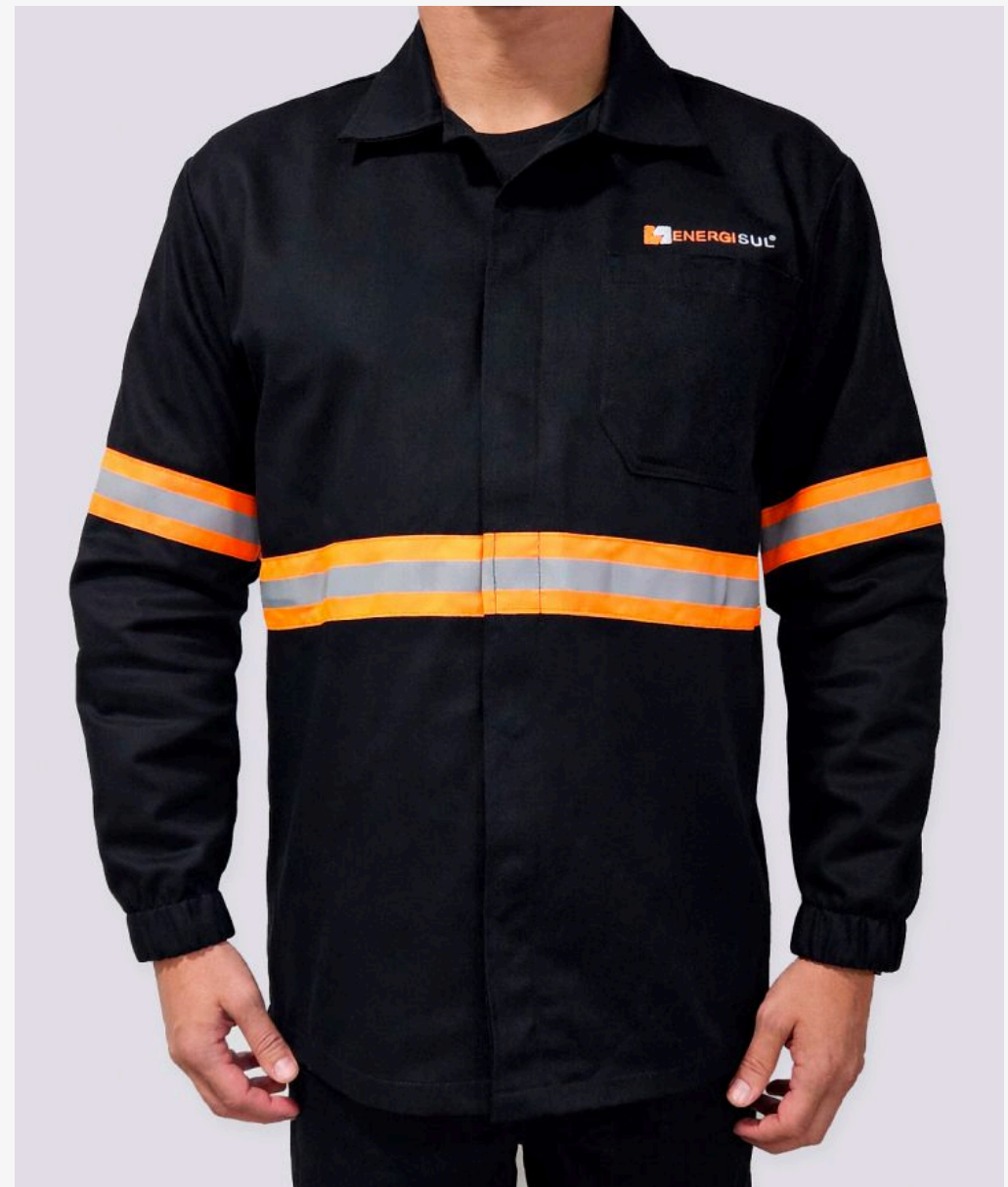
Jaleco industrial manga longa