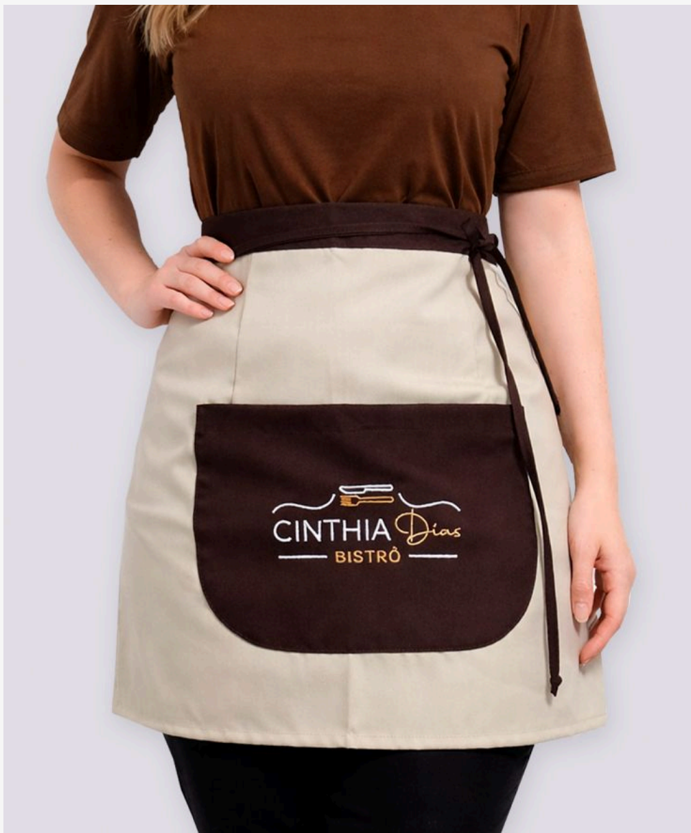
Avental meia cintura feminino