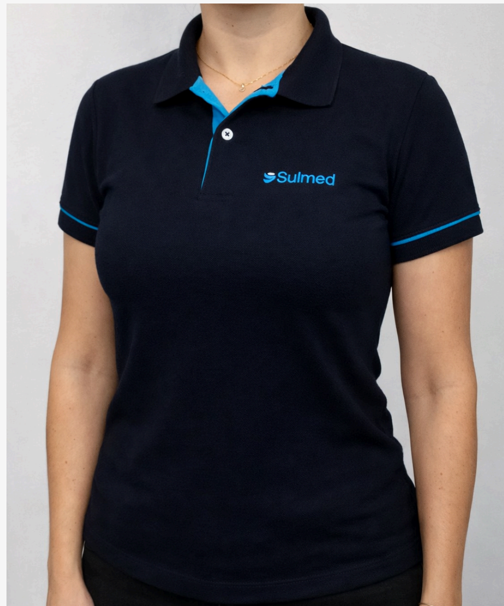
Gola polo com punho e viés