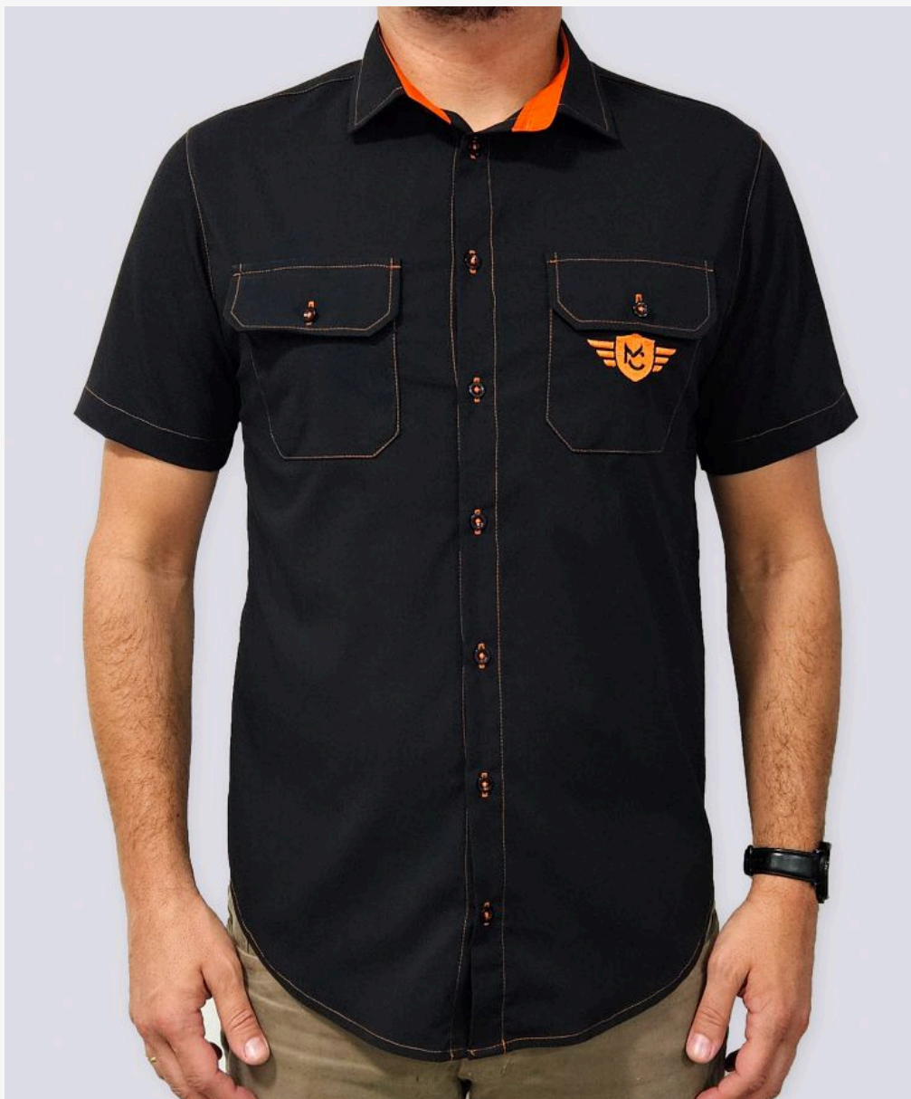
Camisa com bolso e lapela