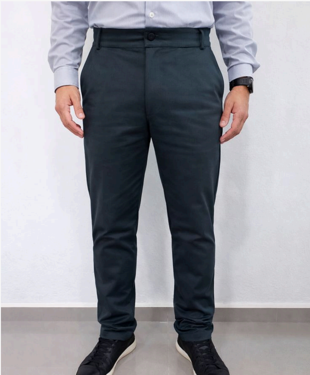
Calça social masculina