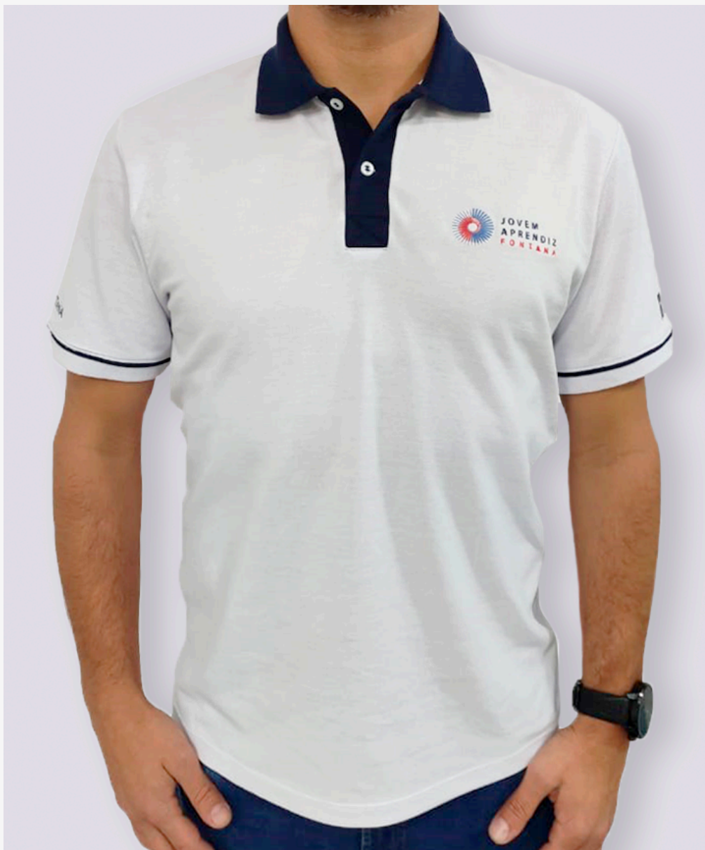
Gola polo com galão duplo