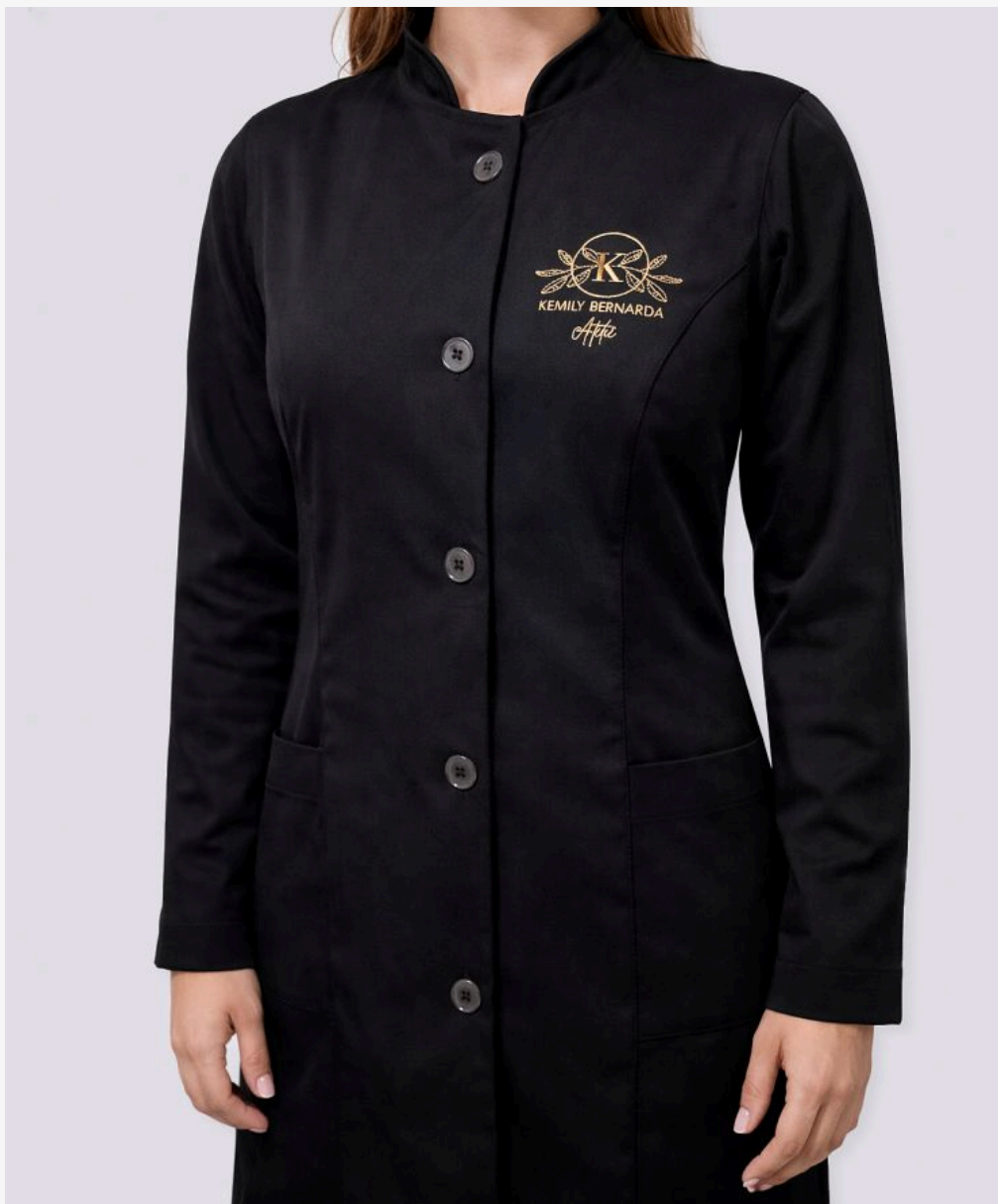
Jaleco gola padre com botões