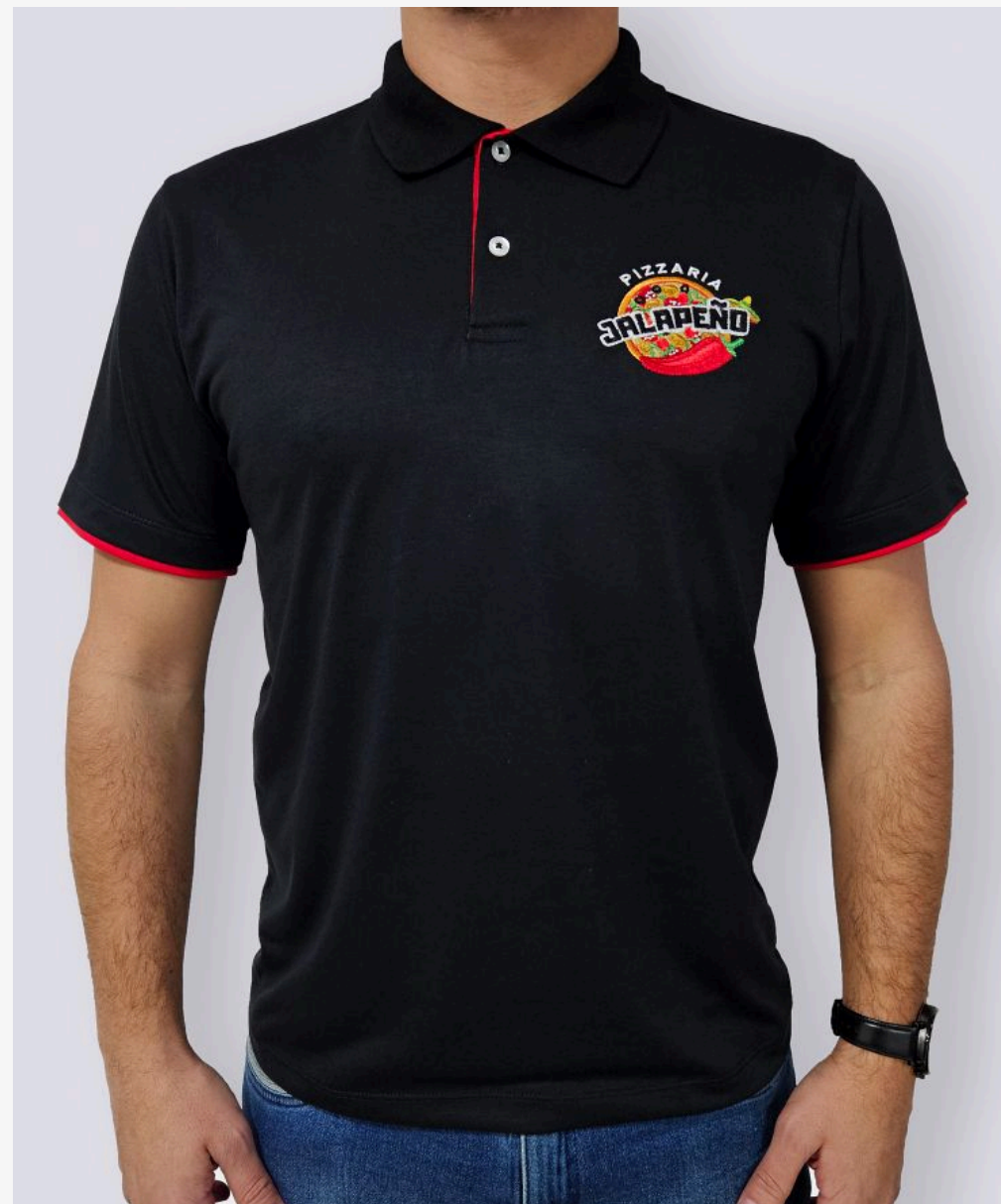
Gola polo com vivo