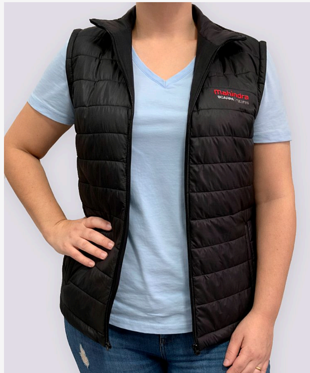
Colete matelado feminino