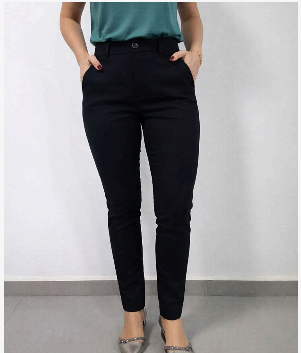
Calça de sarja feminina