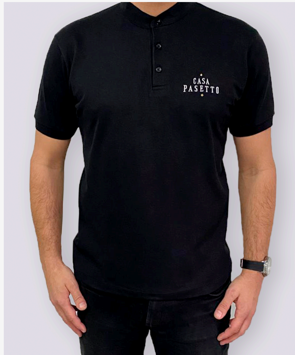
Gola polo com gola padre