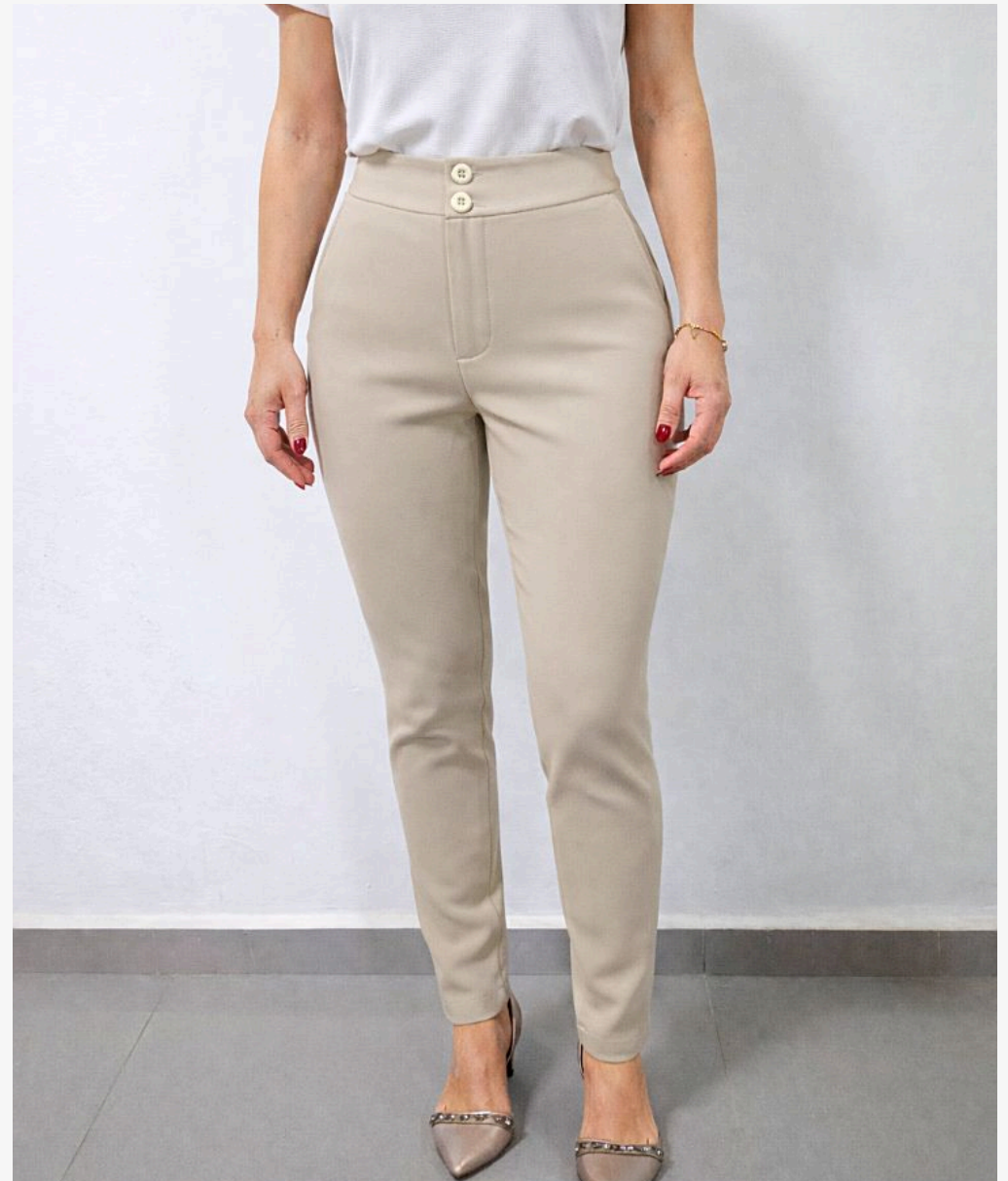
Calça social feminina