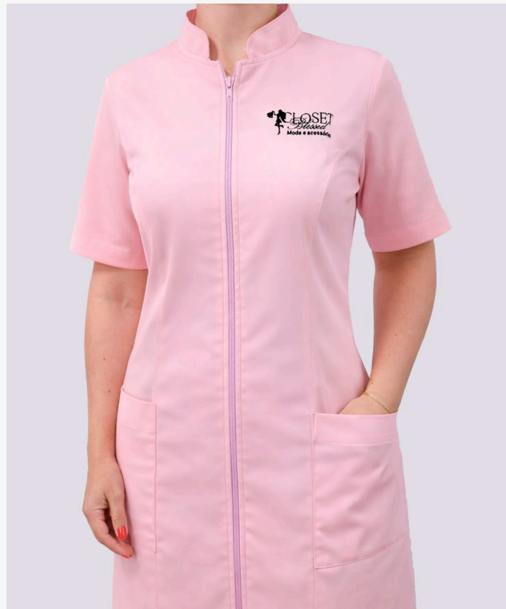
Jaleco gola padre com zíper