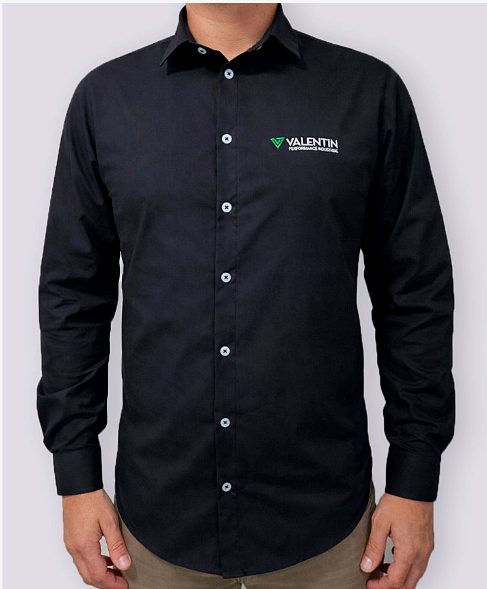
Camisa manga longa