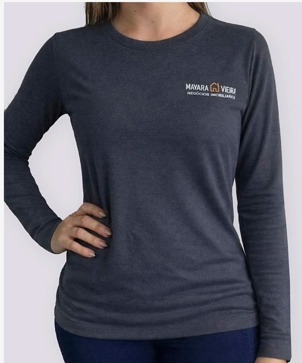
Baby look manga longa