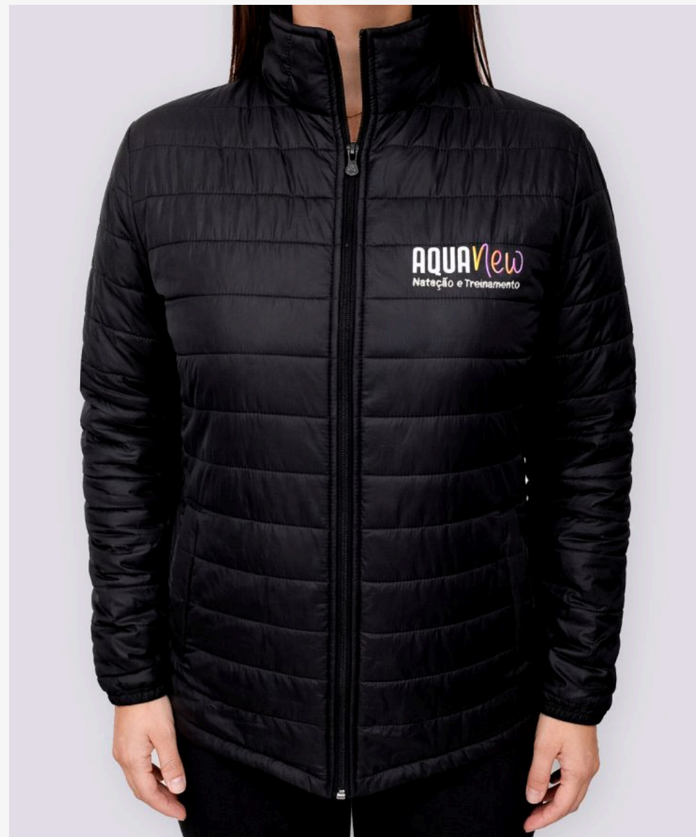
Jaqueta matelada feminina