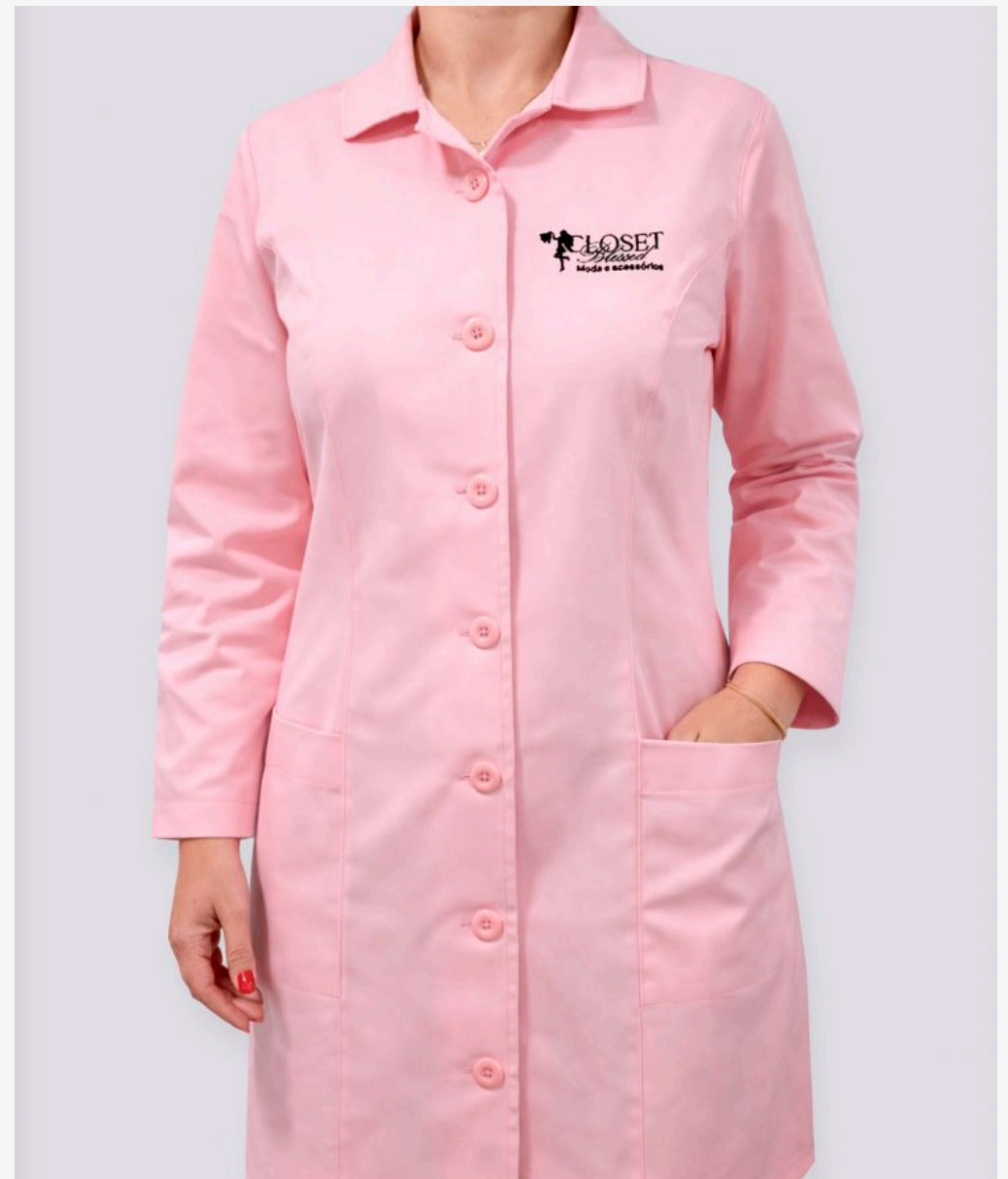
Jaleco manga longa feminino