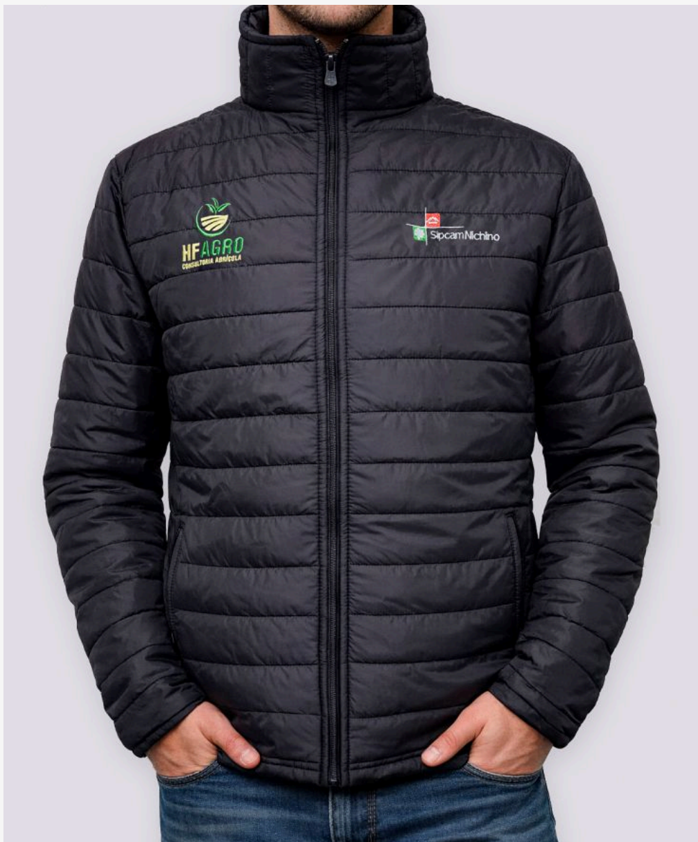
Jaqueta matelada masculino