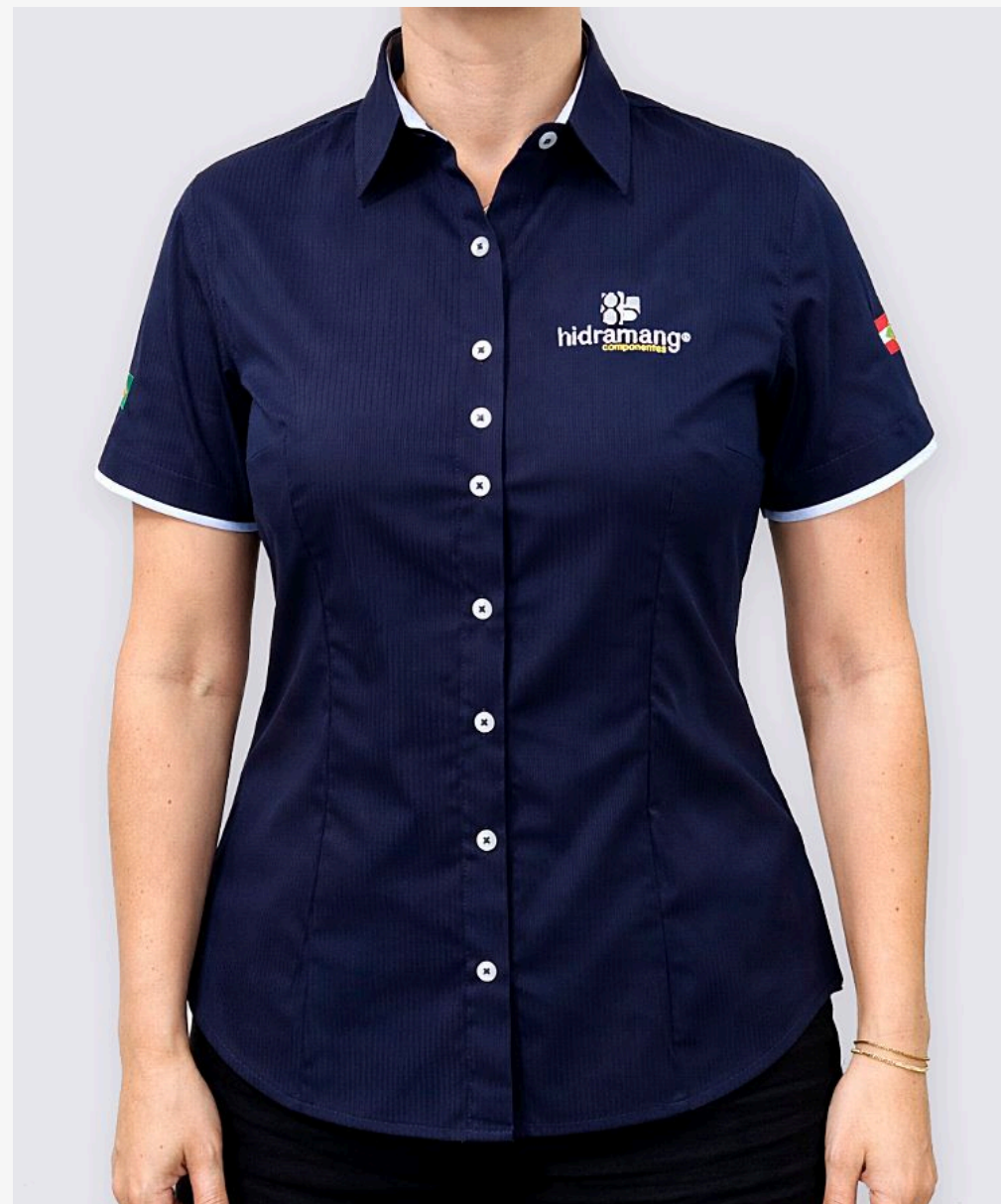
Camisete manga curta com detalhe