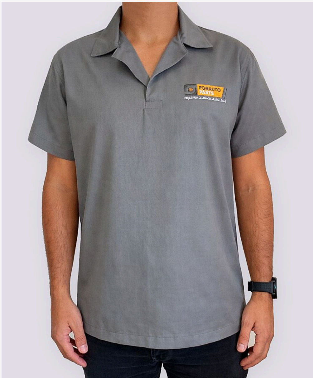
Jaleco industrial decote v