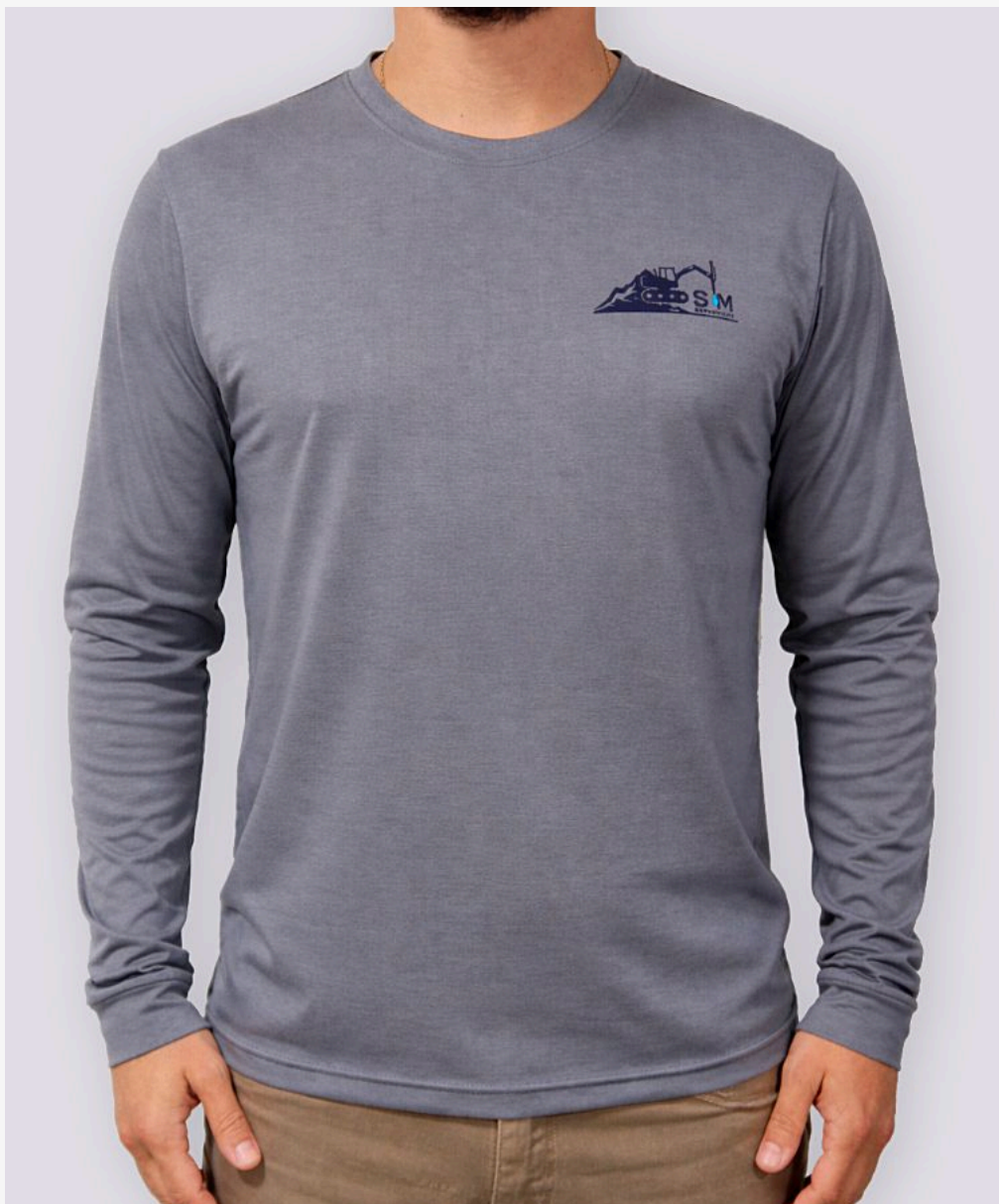
Camiseta manga longa