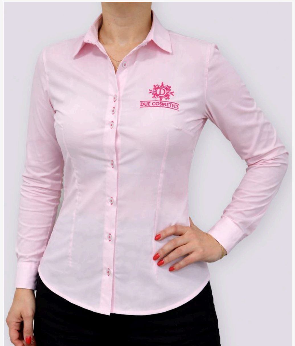
Camisete manga longa