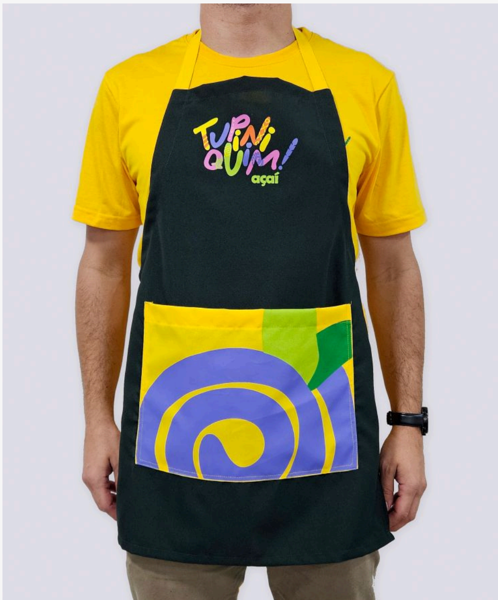
Avental frente única unissex