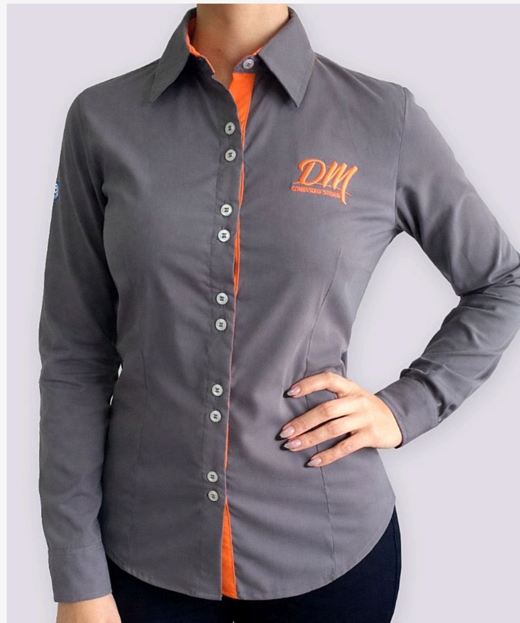
Camisete manga longa com detalhe