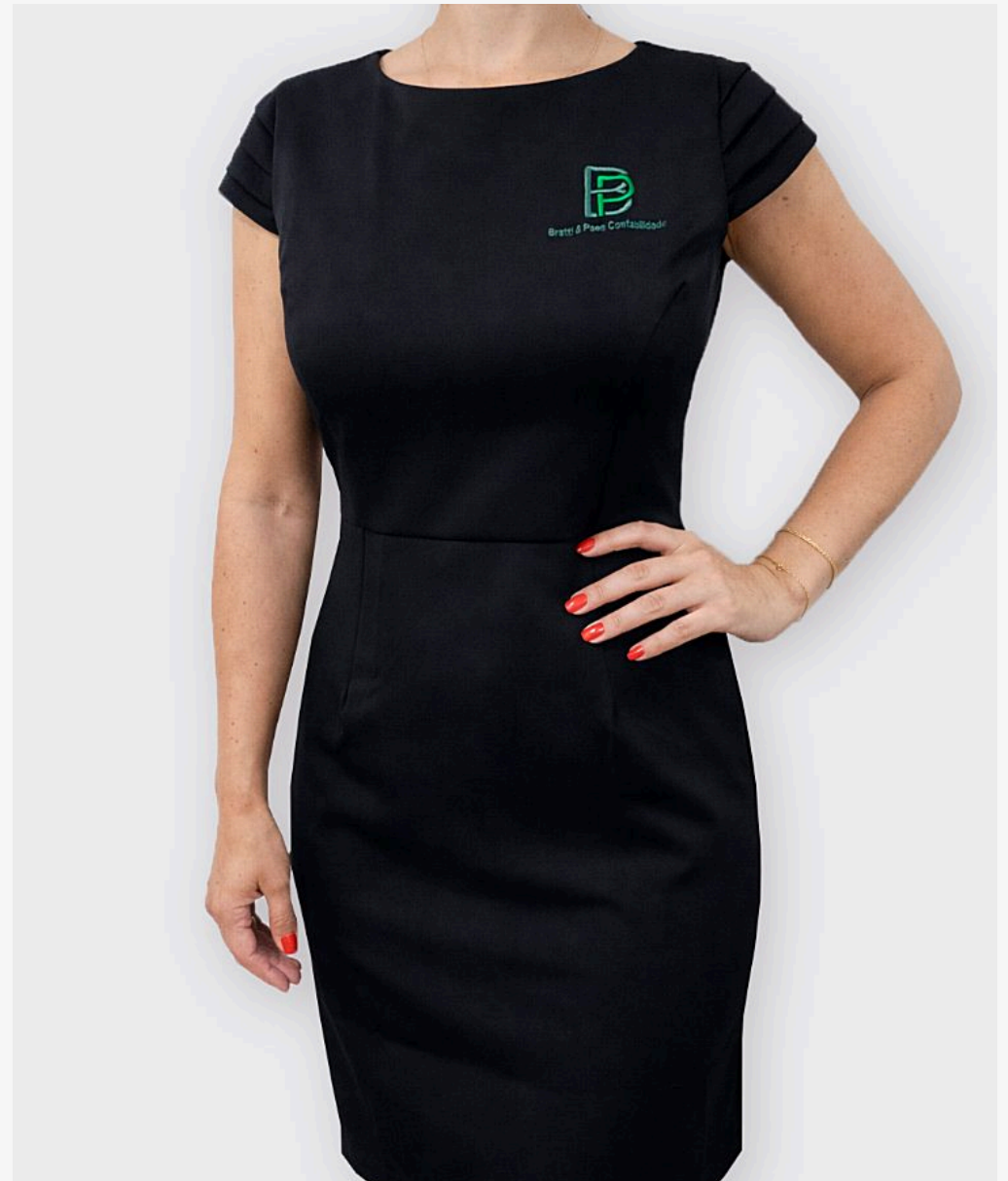
Vestido com recorte