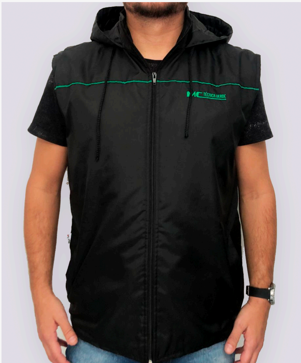
Colete impermeável masculino