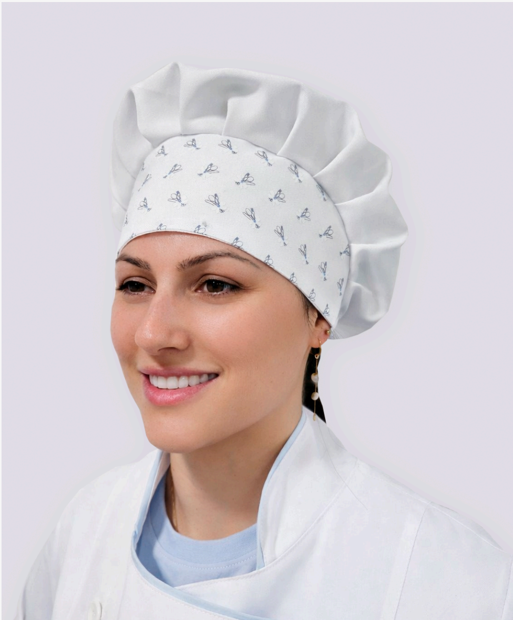
Touca master cheff