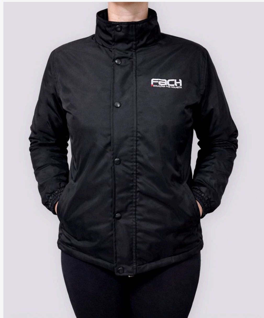
Jaqueta com proteção de zíper feminina Ref: 388