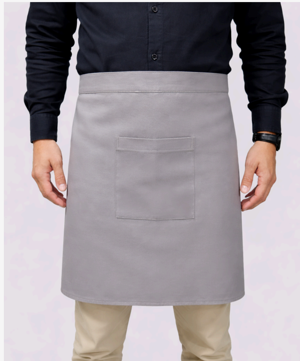
Avental meia cintura masculino