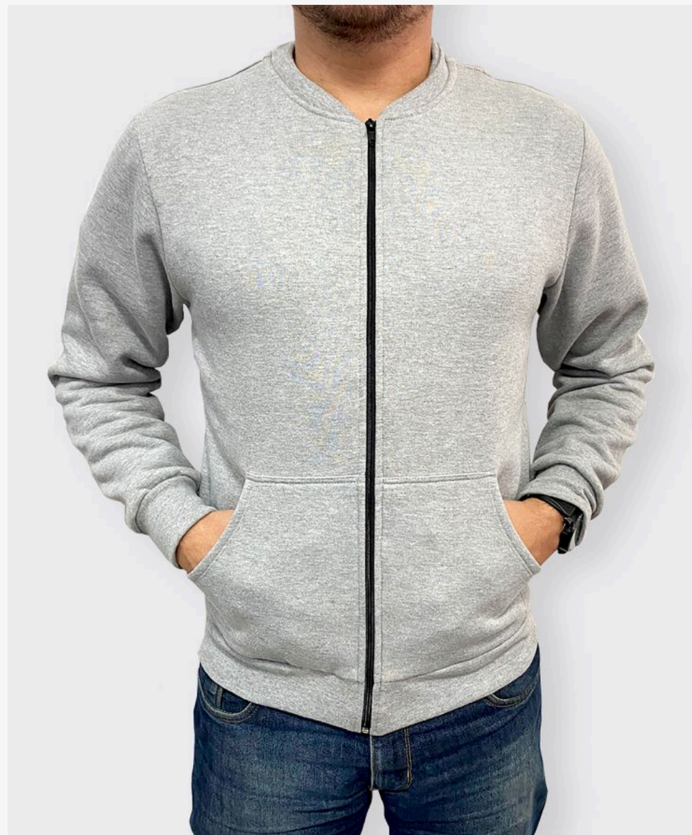
Jaqueta de moletom careca