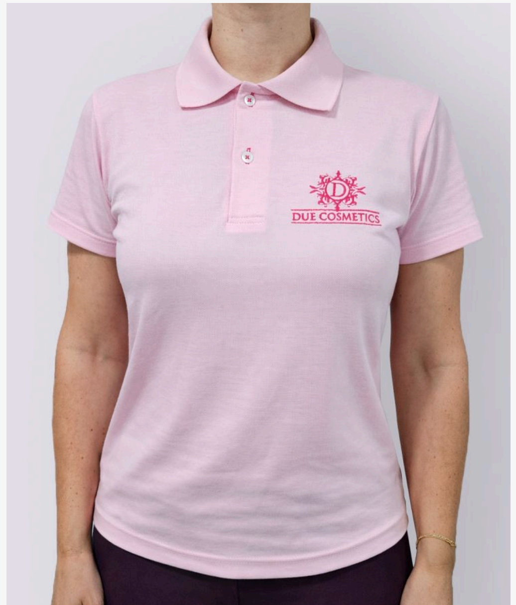
Gola polo básica