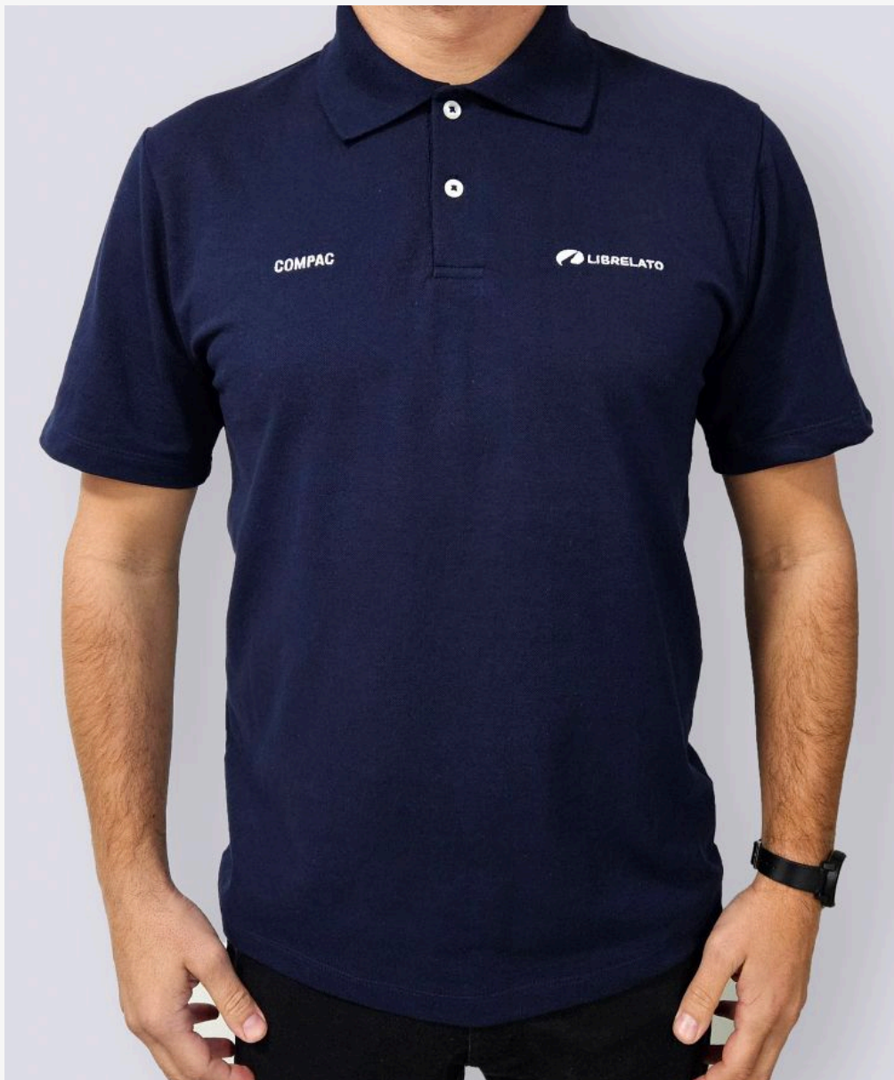
Gola polo básica