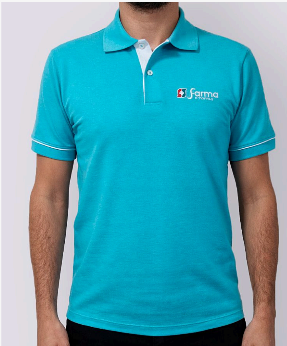
Gola polo com punho e viés