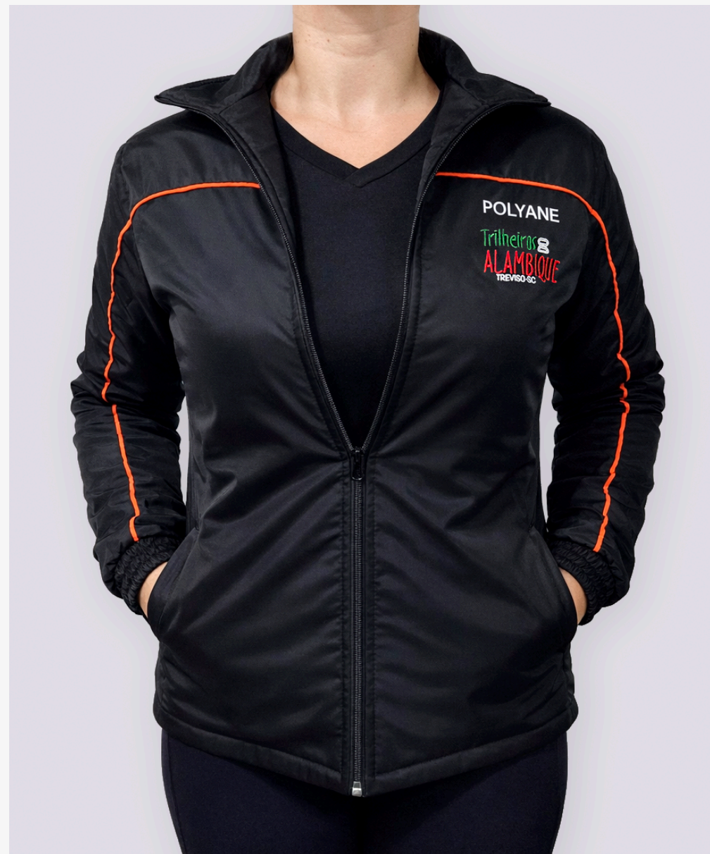
Jaqueta com recorte feminina