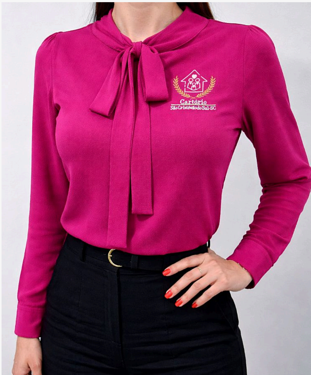
Blusa paris manga longa