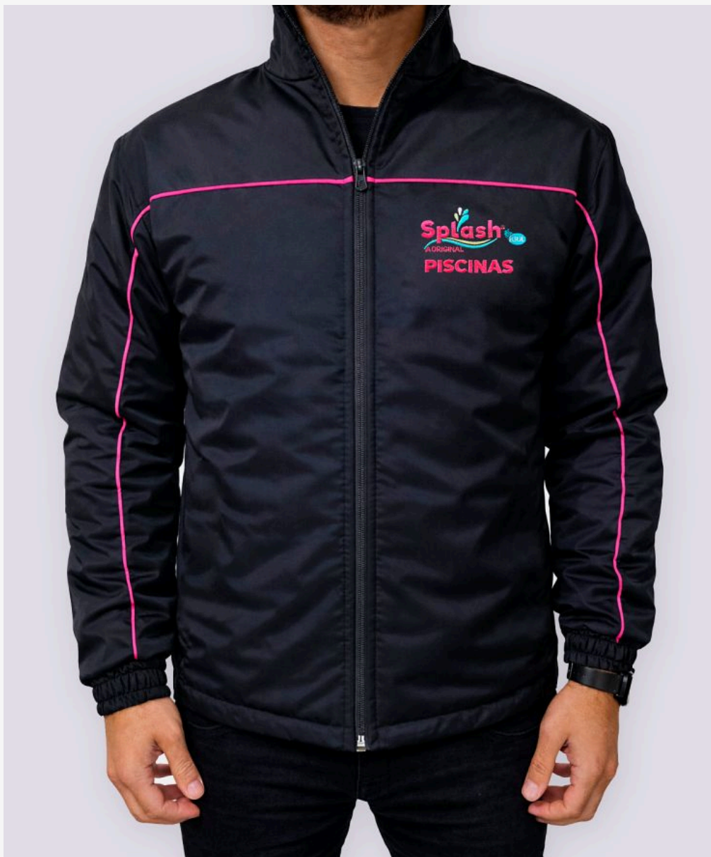
Jaqueta com recorte masculina